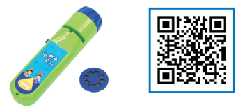
직업 손전등과 필름