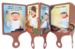
보글보글 남남 요리사